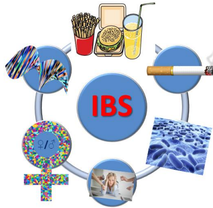
Σχήμα 2. Περίληψη των παραγόντων που επηρεάζουν την εκδήλωση του ΣΕΕ: στυλ ζωής, διατροφή/κάπνισμα, βακτηριακή λοίμωξη, άγχος/τραύμα, γυναικείο φύλο, γονίδια